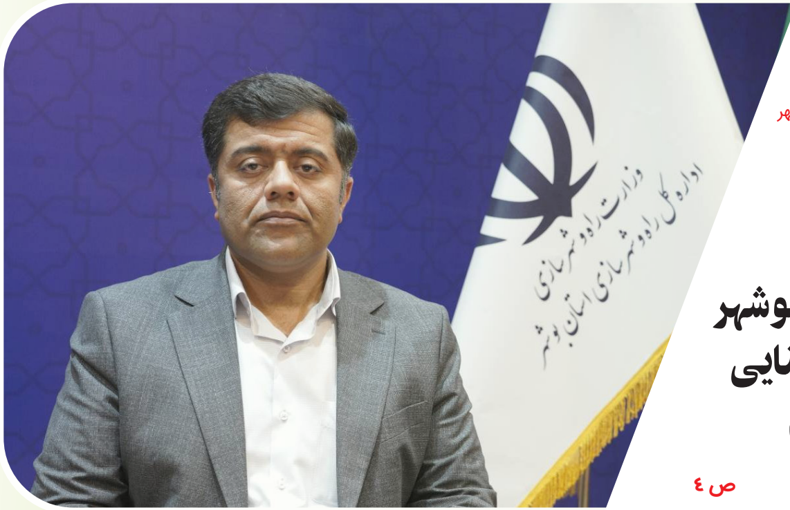
مدیرکل راه و شهرسازی استان بوشهر خبر داد: